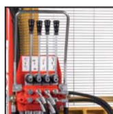
Distributore 4 leve