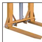
Forche pieghevoli e regolabili