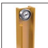
Cuscinetti radiali a rulli cilindrici