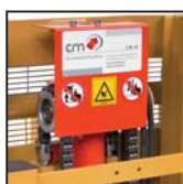
Catene di sollevamento tipo "Fleyer"