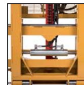
Traslatore laterale Side shift