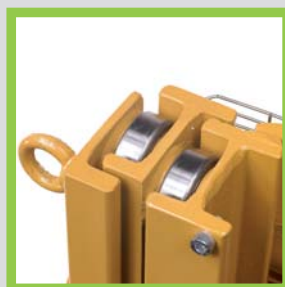
Profili in acciaio laminati a caldo Hot-rolled steel profiles