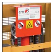
Catene di sollevamento tipo "Fleyer" "Fleyer" type lifting chains