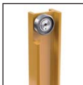
Cuscinetti radiali a rulli cilindrici Straight roller radial bearings