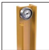
Cuscinetti radiali a rulli cilindrici Roulements à rouleaux cylindriques