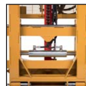
Traslatore laterale Translateur latéral