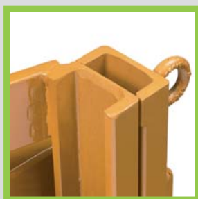
Profili in acciaio laminati a caldo Profils en acier laminés à chaud