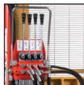
Distributore 4 leve Distributeur 4 leviers