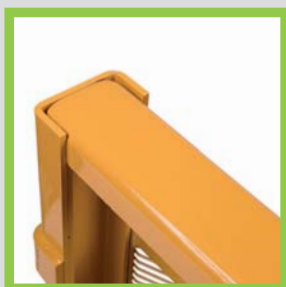
Profili in acciaio piegato Perfiles de acero doblados