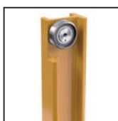
Carrello con cuscinetti radiali a rulli cilindrici Carro con rodamientos radiales de rodillos cilíndricos